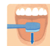
6. Чистка языка

Полость рта маленького ребёнка необходимо очищать после каждого приёма пищи. Для этого рекомендуется давать ребёнку кипячёную воду, а также очищать полость рта мягкой марлевой салфеткой или ватным тампоном, смоченным в тёплой кипячёной воде. После прорезывания первого молочного зуба необходимо приступить к применению детских зубных щёток с мягкой щетиной.