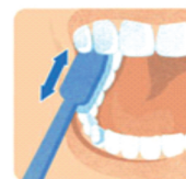
4. Жевательная поверхность зубов