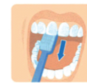
3. Внутренние поверхности передних зубов