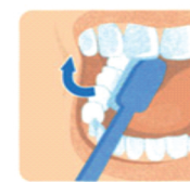
2. Внутренние поверхности зубов